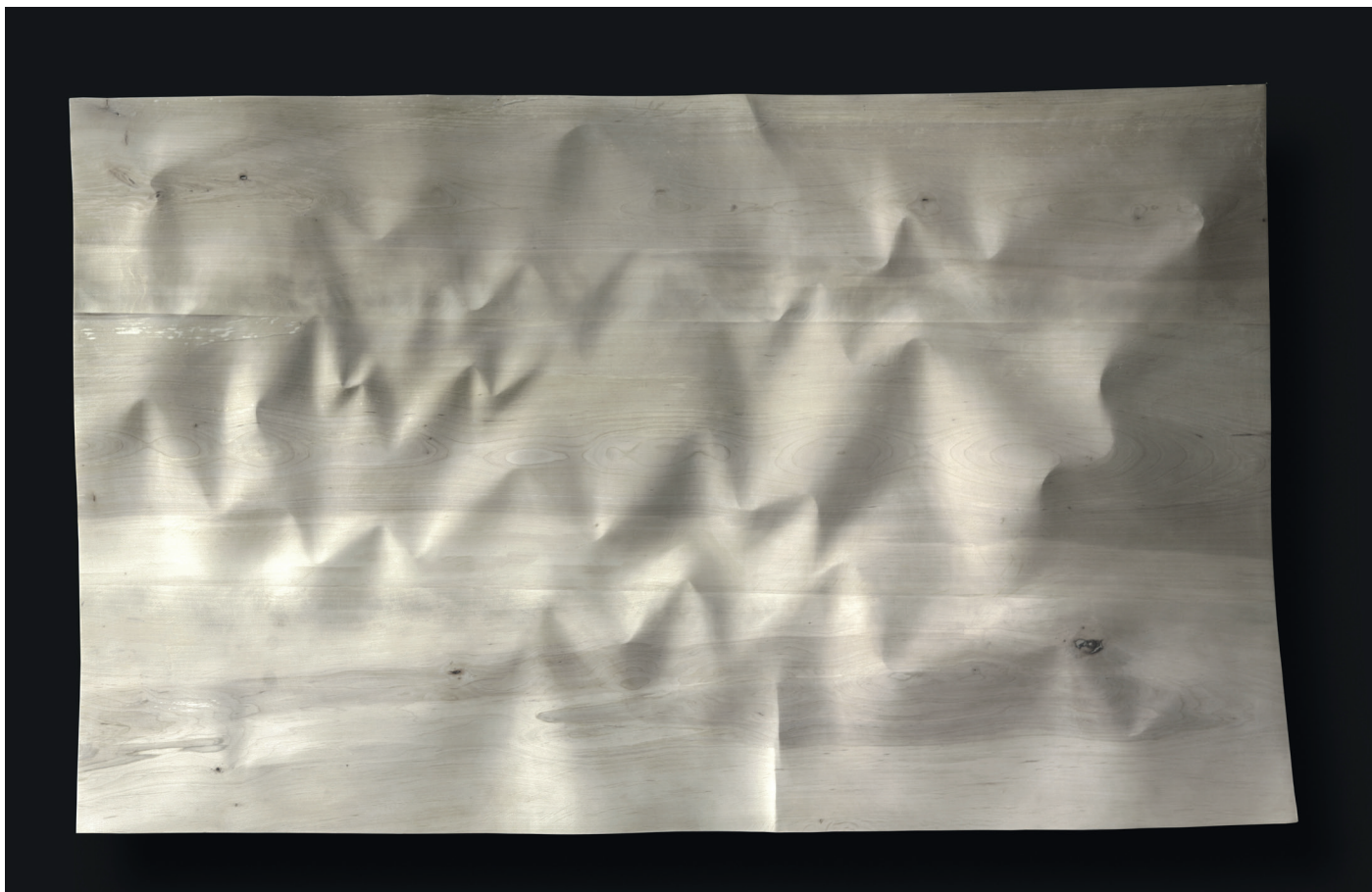
Christian Renonciat, Grand froissé ; bois de tilleul, 82 x 135 x 6 cm, 2023