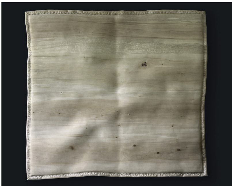
Christian Renonciat, Cachemire gansé ; bois de tilleul, 160 x 170 x 11 cm, 2022