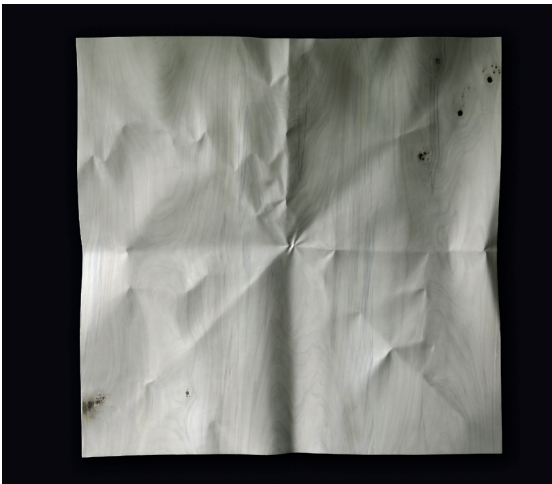
Christian Renonciat, Papier déplié, quatre plis et diagonales ; bois de tilleul, 95 x 96 x 6 cm, 2024