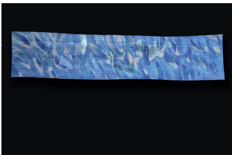
Christian Renonciat, Bleu-bois; oblong , bois de tilleul, 33 x 146 x 6 cm, 2025