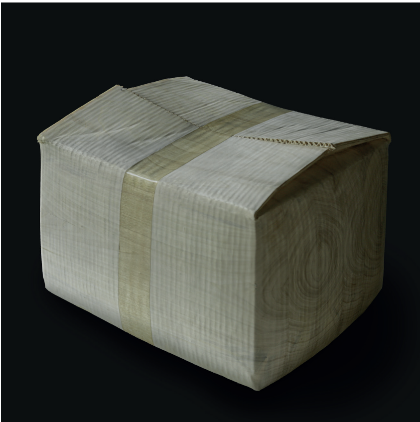
Christian Renonciat, Carton-caisse scotché ; bois de tilleul, 38 x 30 x 30 cm, 2026

Depuis 1976, son travail est régulièrement exposé en France, en Suisse, en Belgique, aux USA, au Japon, en Chine, en Corée du Sud... Tandis que ses installations monumentales peuvent s'admirer à Saumur, Tokyo, Sapporo, Atlanta, San Francisco, Monte-Carlo, Aytré, La Rochelle, Paris, Issy, Reims, Londres ou Séoul.