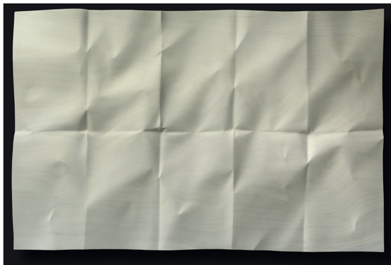
Christian Renonciat, Papier déplié dix plis ; bois d'ayous, 193 x 124 x 4,5 cm, 2025