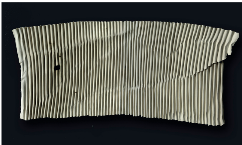
Christian Renonciat, Carton ondé, palmé ; bois de tilleul, 50 x 87 x 6 cm, 2025