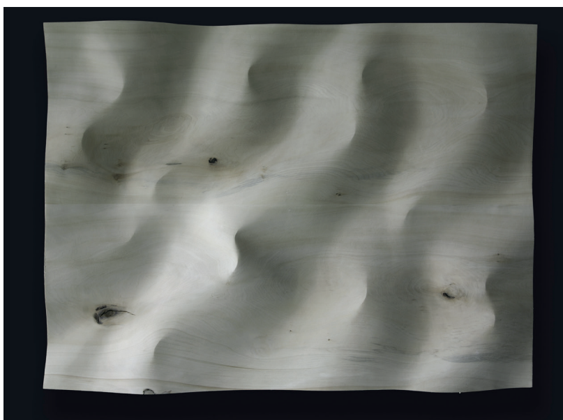
Christian Renonciat, Grand sable ; bois de tilleul, 75 x 104 x 6 cm, 2024